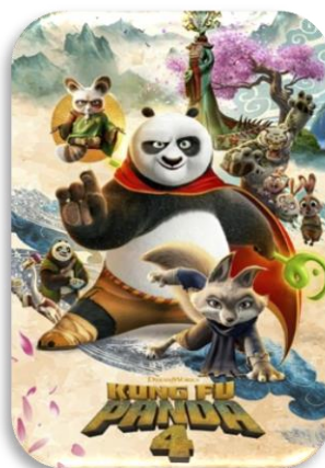
1 time 30 min. 23.11.2024