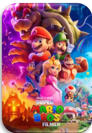
1 time 30 min. 26.10.2024