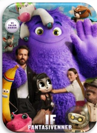
1 time 45 min. 28.9.2024