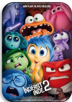
1 time 35 min. 18.1.2025