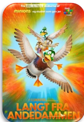
1 time 25 min. 23.2.2025