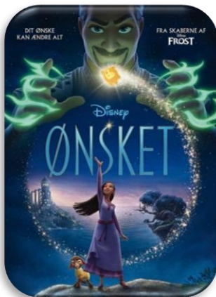
1 time 30 min. 27.10.2024