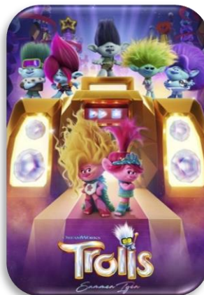
1 time 30 min. 24.11.2024