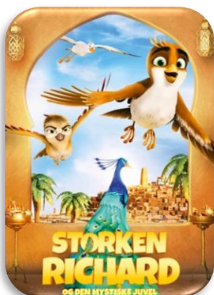
1 time 25 min. 19.1.2025