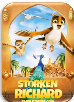
1 time 25 min. 18.1.2025