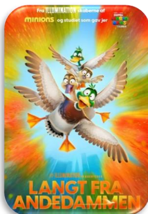
1 time 25 min. 22.2.2025