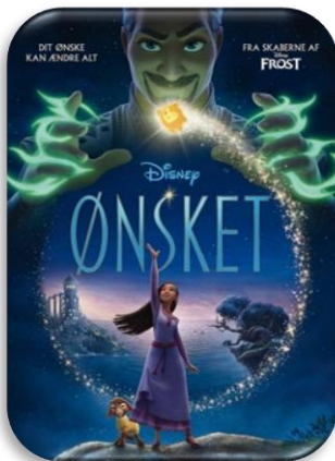
1 time 30 min. 26.10.2024