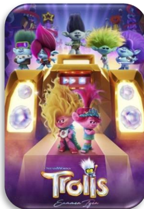
1 time 30 min. 23.11.2024